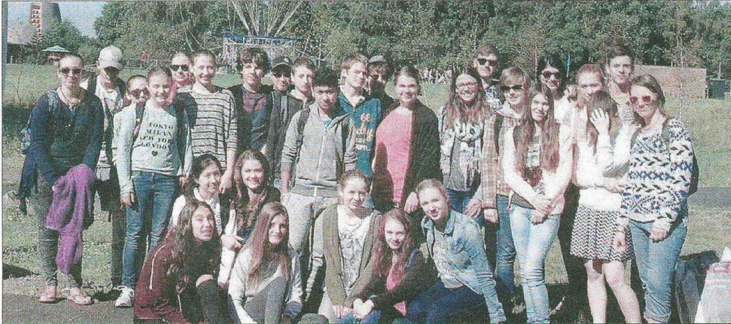
ENSEMBLE. Pas de frontière entre les jeunes Parsbergeois et les Vicomtois largement concernés par les échanges en mai prochain.

Du 5 au 8 mai prochain, une délégation de Parsberg sera présente à Vic-le-Comte pour participer au 29 e anniversaire du jumelage. Un séjour qui correspond également à celui d'une quarantaine de jeunes allemands arrivés dès le début de semaine dans le cadre d'un échange avec le collège de Vic-le-Comte.