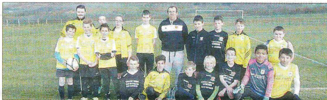
ÉQUIPE. Les moins de 13 ans s'en donnent à cœur joie sur le terrain pour aller marquer.

Les seniors affaiblis par les blessures s'inclinent 2-3 à Clermont Bibliothèque pour la réserve et 1-4