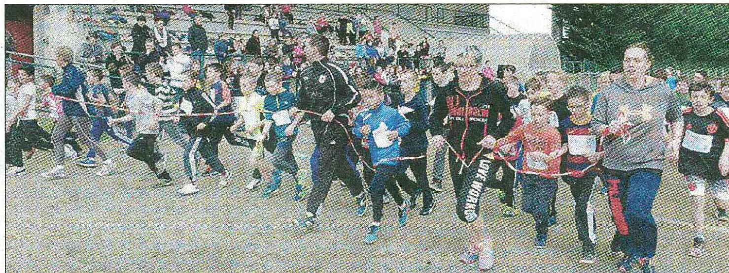
LE LIÈVRE. Un tour de terrain fait avec le lièvre pour ensuite poursuivre seul l'épreuve.

coupes des mains des élus (*). Pour cette compétition amicale, le conseil dé-